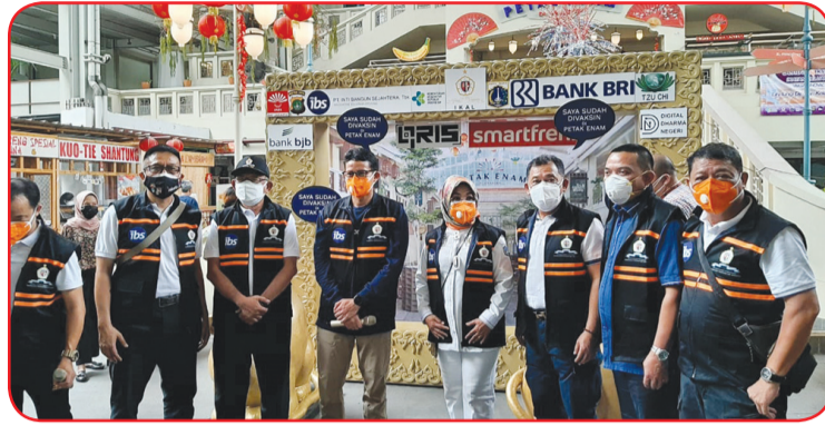
Menparekraf Sandiaga Uno (keempat dari kiri) dan Sylviana Murni (kelima dari kiri) berfoto bersama panitia.