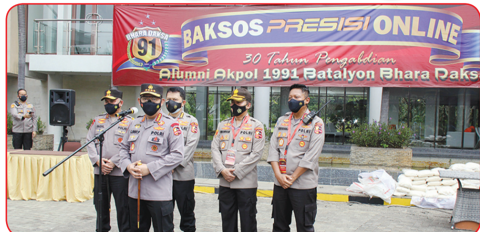
Kapri Jenderal Pol Drs. Listyo Sigit Prabowo, didampingi Kapolda Metro Jaya Irjen Fadil Imran (belakang kiri) dan Brigjen Pol Krishna Murti (belakang kanan) saat memberikan sambutan saat peresmian program Gebrak Baksos Presisi Online.

JAKARTA (IM) - Alumni Akpol (Akademi Kepolisian) 1991 Batalyon Bhara Daks menyelenggarakan kegiatan Bakti Sosial (Baksos) dengan membagikan 1.500 paket sembako gratis kepada masyarakat yang terdampak pandemi Covid-19 di wilayah DKI Jakarta dan sekitarnya. Terhitung sebanyak 1.100 paket baksos didistribusikan kepada masyarakat sekitar perumahan Jakarta Garden City, township seluas 370 hektar dan wilayah Jakarta Timur yang terdampak pandemi Covid-19. Untuk menghindari timbulnya kerumunan, pembagian paket sembako dilakukan dengan mekanisme penjemputan paket sembako menggunakan sistem drive-thru dengan memanfaatkan layanan jemput dan antar (pengiriman) barang yang disediakan oleh aplikasi pengiriman online pada Sabtu (31/7).