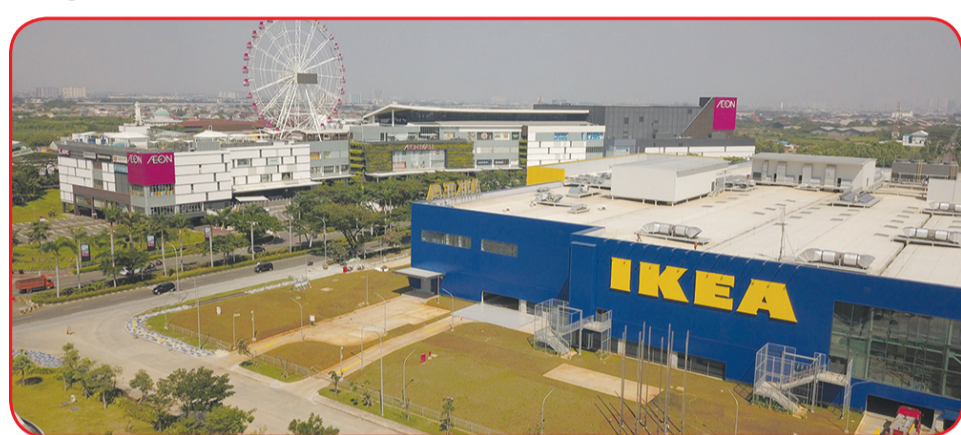
Kawasan Jakarta Garden City.

yang terdampak oleh pandemi Covid-19. "Situasi pandemi Covid-19 berdampak pada ekonomi masyarakat. Semoga dengan digelarnya baksos hari ini dapat sedikit meringankan beban masyarakat yang terdampak Covid-19 dan dalam masa penerapan PPKM," ujar Kapolda. Program bakti sosial pembagian sembako yang diberi nama "Gebrak Baksos Presisi Online" ini sendiri berupa pemesanan paket sembako melalui aplikasi layanan pengiriman barang secara online (Gojek/Grab/Lalamove/Anteraja), bisa untuk diri sendiri dan orang lain. Setelah dilakukan seleksi, verifikasi dan pengecekan oleh panitia, selanjutnya paket sembako yang telah dipesan akan didistribusikan kepada alamat tujuan yang diberikan oleh pemesan. Mekanisme pengecekan setiap pemesanan paket sembako baksos meliputi, validasi nomer handphone pemesan,