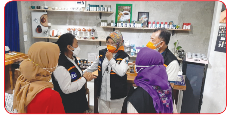
Menteri PPAI I Gusti Ayu Bintang Darmawan saat menjajal jalannya vaksinasi.

JAKARTA (IM) - IKAL (Ikatan Keluarga Alumni) Lemhanas Komprov DKI Jakarta menyelenggarakan vaksinasi gratis, Sabtu (31/7).