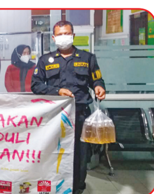
Sebagian Nakes saat menerima paket bantuan makanan GASPOL.