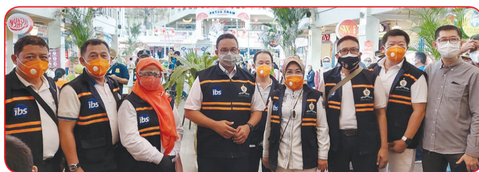
Panitia pelaksana berfoto bersama Gubernur DKI Anies Baswedan.

"Vaksin yang digunakan jenis Sinovac disediakan oleh pihak Kecamatan Tamansari