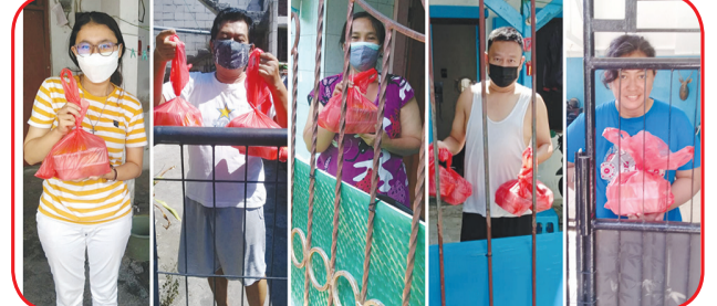
Sejumlah pasien isoman yang menerima paket bantuan makanan GASPOL.

"Mari kita warga Surabaya, bersama-sama untuk bersatu dan saling membantu dalam menghadapi pandemi ini. Kami memohon dukungan dari semua pihak, agar aksi ini bisa berjalan terus dan memberi banyak manfaat," pungkaskannya. • anto tse