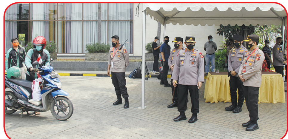
Kapri Jenderal Pol Drs. Listyo Sigit Prabowo, didampingi Kapolda Metro Jaya Irjen Fadil Imran dan Brigjen Pol Krishna Murti, melihat secara langsung proses penjemputan paket sembako gratis oleh ojek online yang berpartisipasi pada program Gebrak Baksos Presisi Online.

Tak hanya itu, Kapri juga mengapresiasi rekan-rekan panitia yang sudah melaksanakan pembagian bansos yang dikemas melalui mekanisme secara online tersebut. Termasuk kepada para alumni Akpol 91 yang telah menginisiasi kegiatan ini. "Saya sangat mengapresiasi rekan-rekan panitia karena hari ini sedang merayakan ulang tahun angkatan yang kemudian mencoba ikut melaksanakan program-program pemerintah salah satunya melalui vaksinasi dan membantu pemberian bansos kurang lebih 30 ribu paket," ujarnya. Sementara itu, Kapolda Metro Jaya Irjen Pol Fadil Imran mengungkapkan, selain di Jakarta, baksos ini juga dilakukan oleh Alumni Akpol 91 Bhara Daks di beberapa kota lainnya di Indonesia, dengan membagikan puluhan ribu bantuan sosial, sebagai bentuk ungkapan rasa syukur dengan cara membantu kepada warga