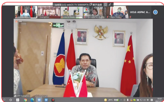
Dubes RI untuk Tiongkok Djauhari Oratmangun.