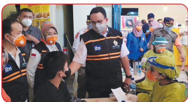
Gubernur Anies Baswedan menyapa peserta penerima vaksin.

Menteri Kesehatan Budi Gunadi Sadikin, Menteri Pariwisata dan Ekonomi Kreatif Sandiaga Salahudin Uno, Menteri Pemberdayaan Perempuan dan Anak Indonesia I Gusti Ayu Bintang Darmawan, Ketua Lemhanas Agung Gumelar dan Gubernur DKI Anies Baswedan turut hadir meny-