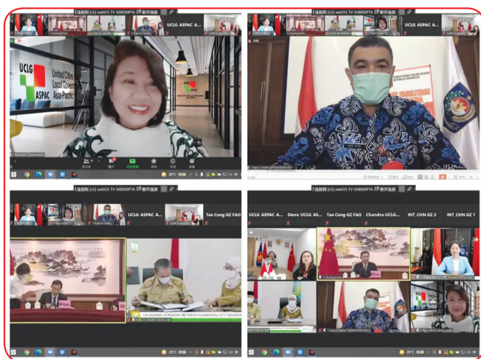
Para undangan yang hadir dalam penandatanganan online tersebut.